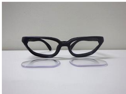
圧縮後の Galileo G01

※N（ニュートン）：力の大きさを表す単位。数値が大きいほど強い圧力を意味します。