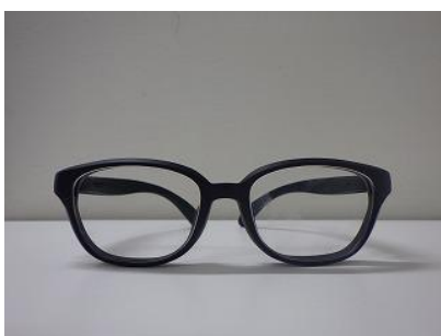
手動復元後の Galileo G01