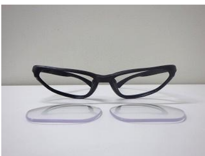
圧縮後の Galileo S01