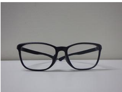
手動復元後の Galileo S01

※本リリースで紹介する実証実験は、Galileo シリーズ共通の素材・構造に基づくものであり、一部試験は大人向けモデルの結果を含みます。耐熱試験以外は「Galileo S01」「Galileo G01」を対象とした試験です。