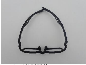
120℃耐熱試験後の Galileo S01