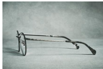
現代の加工技術を用いて 細かく施されたつるのデザイン