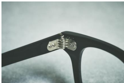
希少なカシメ丁番と 7 枚丁番パーツを採用