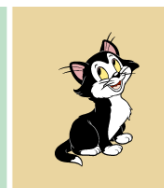
フィガロ (ピノキオ)