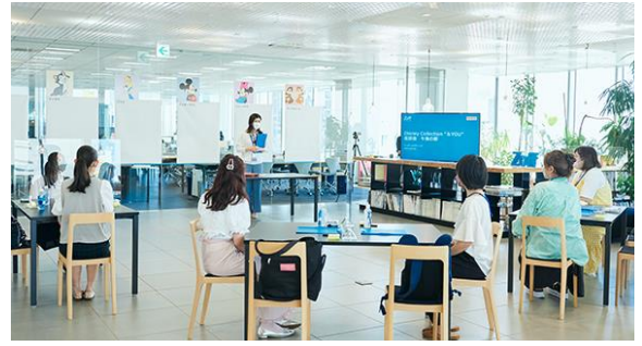
↑商品のこだわりを商品部から直接ご説明。