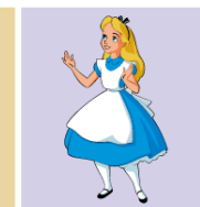
アリス (ふしぎの国のアリス)