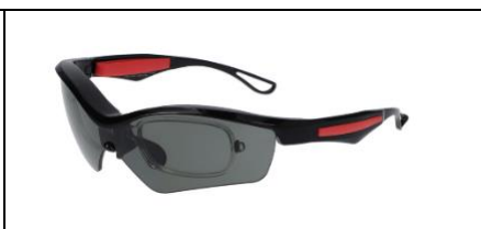
ZA201G06_14E2 (度付きスポーティサングラス)