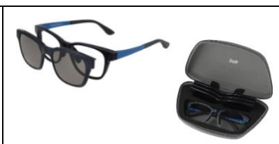
ZA211G05_72E1 ※WEB 限定商品 (Zoff OUTDOOR for FISHING)